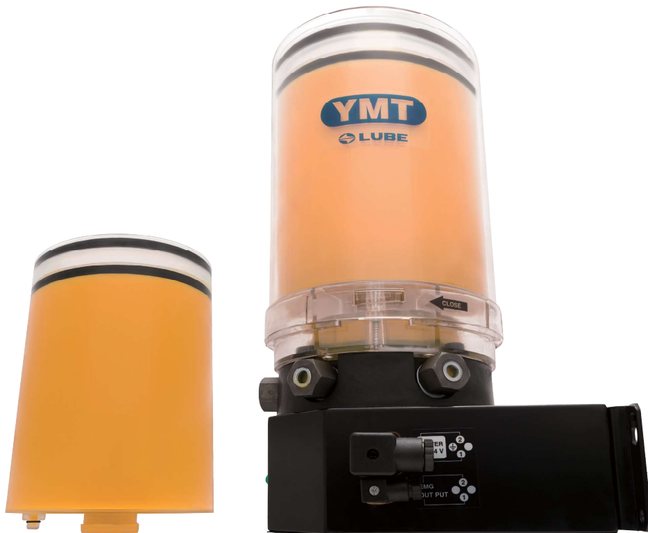
大容量4ℓカートリッジ

お問い合わせに関しては リユーベ・グローバルセンター 「情報戦略センター」 〒514-0131 三重県津市あかつ台 4-2-1 Tel. (059)253-3980 (代) Fax. (059)253-3981