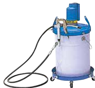
エアー駆動型ペール缶用ポンプ