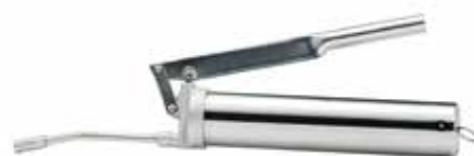
ハンドグリスガン