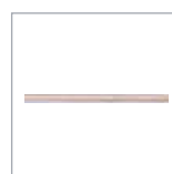
主配管 P. 140