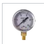
圧力計 P. 56