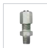
主配管用継手 P. 156