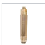
MG2C 型定量バルブ P. 34