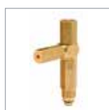
MG2I 型定量バルブ P. 35