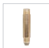
MG2 型定量バルブ P. 34