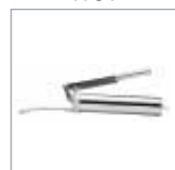
ハンドグリスガン P. 57