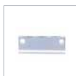
JVPA 型ジャンクション P. 33