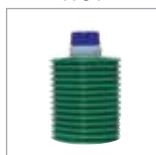
リユーベオリジナル グリス P. 50