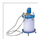
ボール缶用ポンプ P. 5057