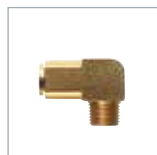
ワンタッチ継手 P. 160