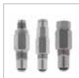
MU 型定量バルブ P. 20