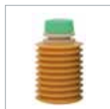
CBT カートリッジ P. 54