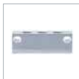
MUJ 型ジャンクション P. 21